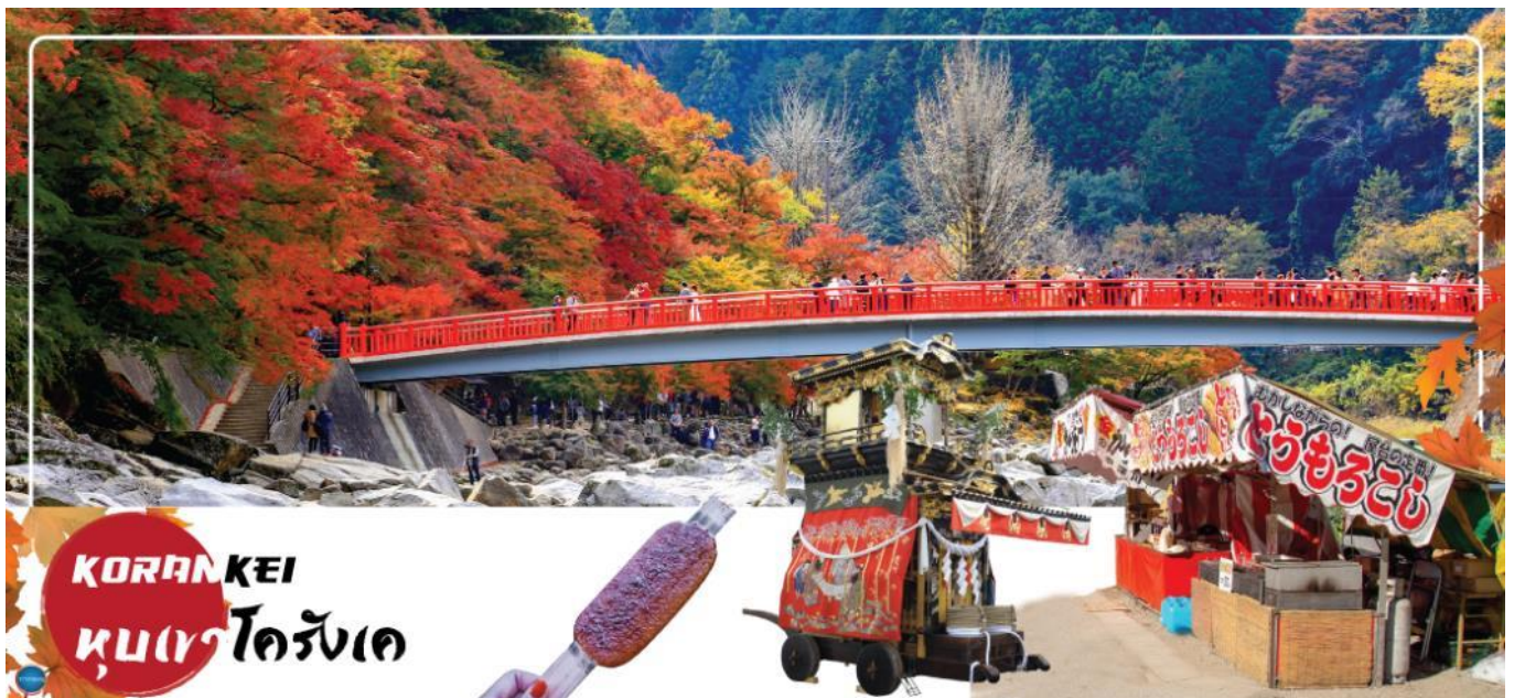
ข้อปิ้งชินไซบาชิ

วันที่ห้า เมืองนาโกย่า – หุบเขาโครังเค – เมืองเกียวโต – การเรียนพิธีชงชาญี่ปุ่น – เมืองโอซาก้า –