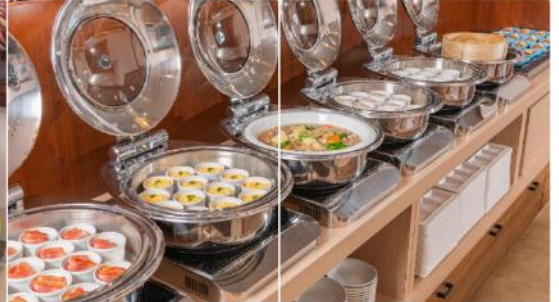
พักที่ ALPICO PLAZA HOTEL หรือเทียบเท่าระดับเดียวกัน

วันที่สี่ เมืองมัตสึโมโตะ – ปราสาทมัตสึโมโตะ(ด้านนอก) – เมืองนากาโนะ – คามิโคจิ –